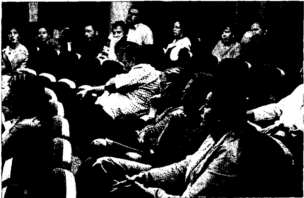
Público asistente a las jornadas.