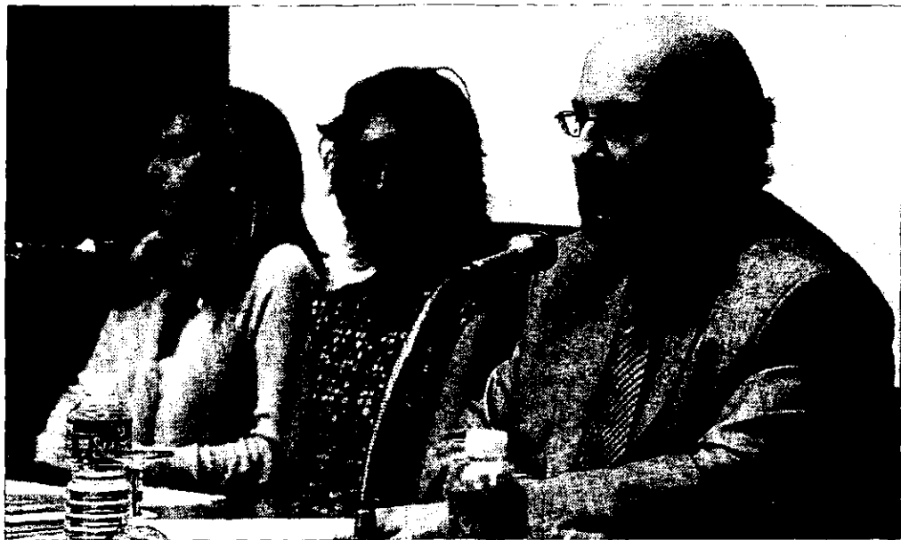
Momento de una de las charlas en el Ateneo.

Así, el Colegio de Abogados mostró su satisfacción por la firma del citado convenio, ya que entiende que "es un paso importante" en aras a solucionar una antigua preocupación tanto suya como de la Subcomisión de Extranjería del Consejo General de la Abogacía y de la Oficina del Defensor del Pueblo, que es la falta de garantías esenciales que se pudieran producir en las repatriaciones de estos menores, sin que en los procedimientos administrativos seguidos el menor gozara de la asistencia letrada prevista en la Ley de derechos y libertades de los extranjeros.