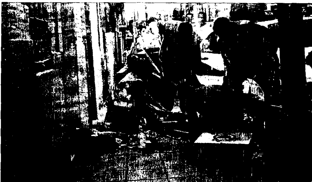
Miembros del Samur asisten en Vallecas a una mujer arrojada por el balcón por su pareja.

Este centro trata el estrés post-traumático de las maltratadas y presta terapias individualizadas y en grupo. La asistencia integral y especializada que ofrece se dirige a todas las formas de violencia