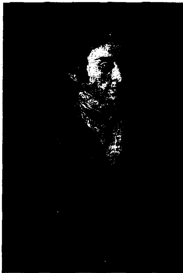
Retrato de Silveira, de Goya, que puede verse en la exposición.

Derecho y la Justicia" reconstruirá la historia de una generación de juristas aragoneses que impulsaron el entendimiento que permitió la aprobación en España del Código Civil, tras un largo proceso en el que quedarían salvaguardados los derechos forales. Y lo hará reuniendo diversos oleos, documentos y libros, y girando en torno a la figura y obra de Joaquín Costa, del que se reconstruye su despacho.