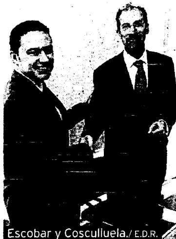
Escobar y Cosculluela./E.D.R.

El titular de Administraciones Públicas, Conrado Escobar, y el decano del Colegio de Abogados de La Rioja, Carlos Sáenz Cosculluela, renovaron ayer el convenio de colaboración para la prestación del servicio de asesoría y defensa jurídica a las víctimas de delitos violentos en el ámbito familiar. El Gobierno riojano aportará un total de 29.000 euros. /E. PRESS