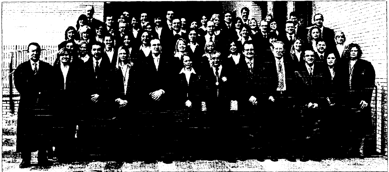
Los 46 nuevos letrados del Colegio de Abogados de Castellón posan tras jurar sus cargos ayer en la Ciudad de la Justicia.