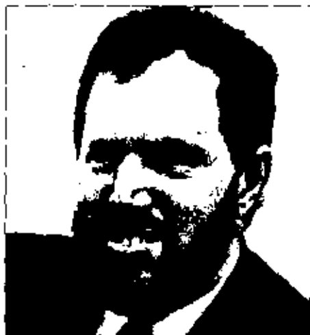
Peter Kovacs, presidente de la Abogacía Europea (CCBE).

Propone que queden excluidas las actividades llevadas a cabo por un abogado en cualquier representación de clientes, ya sea judicial, extrajudicial o administrativa. Además quieren que quede abierto todo asesoramiento jurídico sobre políticas y procesos de toma de decisiones de las instituciones europeas y, sobre todo, las respuestas realizadas a petición de