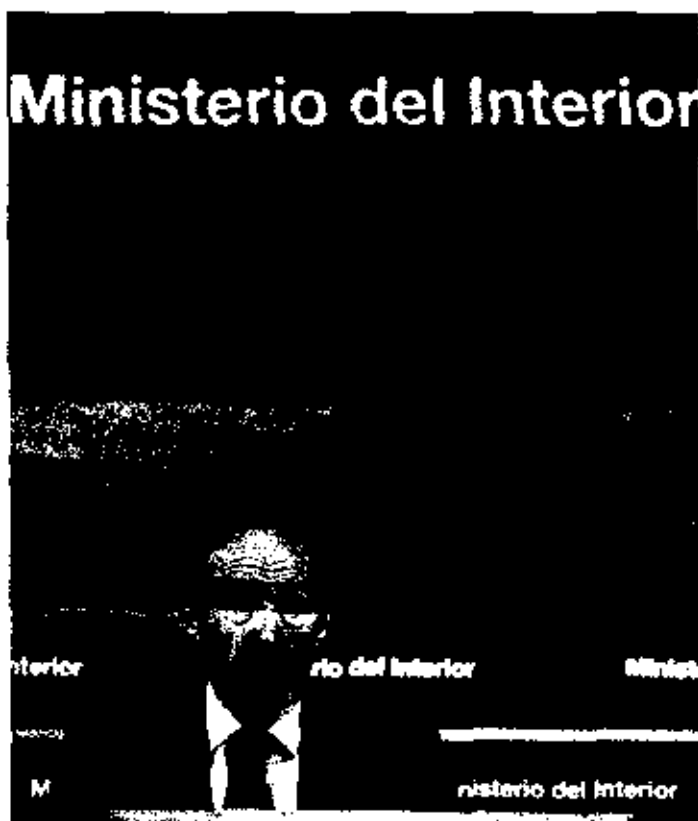
El ministro del Interior, Alfredo Pérez Rubalcaba, ayer, en Madrid.

A lo largo de los últimos años, España ha endurecido las condiciones que exige a los inmigrantes para entrar en nuestro país de manera legal. Ha aumentado la cantidad económica que se les pide que dispongan y ha modificado la carta de invitación.