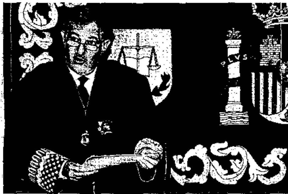
Cándido Conde-Pumpido durante su intervención en la toma de posesión del teniente fiscal de la Audiencia.

Aunque las demandas de ilegalización lleguen un incidente de ejecución de la senten-