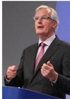
Michel Barnier, Comisario europeo de Mercado Interior

La Dirección General de Mercado Interior de la Comisión Europea organizó ayer lunes en Bruselas una conferencia titulada: “El Mercado Interior de los Abogados: valorando sus éxitos, atajando sus restantes objetivos” en la que se ha evaluado el marco regulatorio especial que establecen las Directivas sectoriales para abogados en la UE: la Directiva 77/249/CEE, sobre libre circulación de abogados y la Directiva 98/5/CE sobre libre establecimiento de abogados. Esta conferencia se enmarca dentro de los esfuerzos de la Comisión Europea por comprender y establecer un diálogo para mejorar el desarrollo y el alcance de las profesiones reguladas en Europa. Gracias a ambas y a la Directiva sobre reconocimiento de cualificaciones profesionales puede decirse que la de Abogado es la profesión que mejor regulada está a nivel europeo. Recientemente se publicó un estudio a cargo de la Comisión, al consorcio Universidad de Maastricht – Panteia al respecto, del cual se hizo eco el Comisario Barnier en su intervención inaugural. El Comisario valoró positivamente estas Directivas y solicitó a CCBE un esfuerzo adicional para acordar una deontología europea única y resolver los problemas de los seguros de responsabilidad profesional. En la conferencia intervinieron varios representantes de la Abogacía europea, como su Presidente, su Secretario General, Presidentes de comités, y el delegado del CGAE en Bruselas que expuso el modelo de facilitación de tecnología del CGAE para la Abogacía Española.