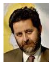
Ignacio García Bercero, Director DG Markt encargado de negociaciones con EE.UU. y Canadá

La Unión Europea y Estados Unidos han anunciado una segunda ronda de negociaciones dentro del partenariado transatlántico sobre comercio e inversión (TTIP en sus siglas en inglés), que tendrán lugar del 11 al 15 de noviembre en Bruselas, tras la solución del cierre administrativo del gobierno norteamericano. Este nuevo encuentro pondrá el plan de negociación TTIP de nuevo en marcha, discutiendo cuestiones como servicios, inversión, energía y materias primas y temas regulatorios. La sesión sobre contratos públicos se celebró antes del cierre gubernamental referenciado. La siguiente ronda de negociaciones con Estados Unidos en el marco TTIP se celebrará antes de fin de año, de nuevo en Washington (EE.UU.). Respecto a la ampliación e incorporación de nuevos Estados miembros a la UE, ésta y Turquía han abierto un nuevo capítulo sobre política regional -y van 14-, en las negociaciones sobre su futura adhesión, tras más de 3 años y medio sin abordar este asunto. El Comisario Füle, encargado de ampliación, ha señalado que Turquía es un socio importante para la UE, y que los desarrollos legislativos que se están acometiendo en el país durante este último año demuestran que Turquía mira a Europa a la hora de acometer las reformas que se le exigen. Se espera que próximamente puedan abrirse los capítulos relativos a derechos fundamentales, libertades y principios básicos de la UE que rigen en Turquía, pudiendo desembocar, con el tiempo, en futuras negociaciones de adhesión.