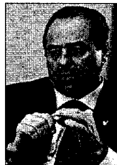
Antonio di Pietro.

La nueva norma permite las escuchas para las investigaciones sobre crimen organizado y terrorismo, pero no para los delitos de corrupción. Esto, para Di Pietro, "significa que el Gobierno renuncia también a perseguir a los grandes criminales. Porque para descubrir que un grupo de personas delinque de forma organizada, que una serie de delitos específicos forman parte de un diseño criminal, primero se necesitan las investigaciones, y precisamente las escuchas. Desde el