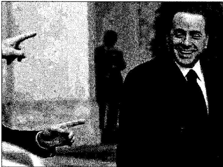
Silvio Berlusconi sale del Palazzo Chigi, en Roma, el pasado 3 de junio.

La Liga del Norte, socio de Berlusconi, ha puesto también reservas a la idea, porque considera que puede dañar la imagen de firmeza del Ejecutivo. Pero el Gobierno ha empezado a preparar a la opinión pública para la