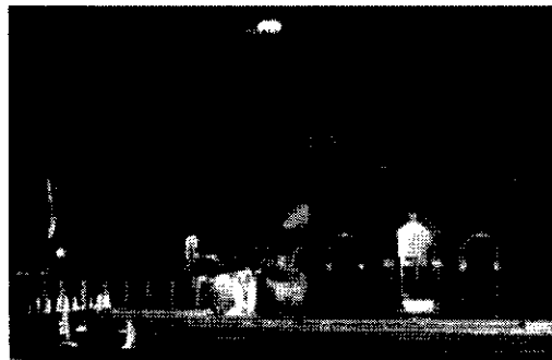
El Castillo del Bil-Bil acogió a los asistentes en el taller inaugural.

El encuentro versó sobre la materia de de Turno de Oficio, un servicio necesitado de mejoras