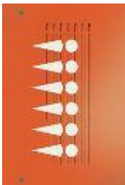
Aplicación de la política de Justicia Penal de la CE