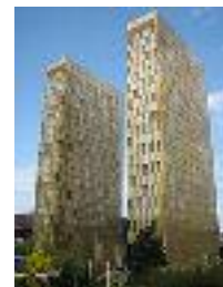
Sede del TJUE en Luxemburgo