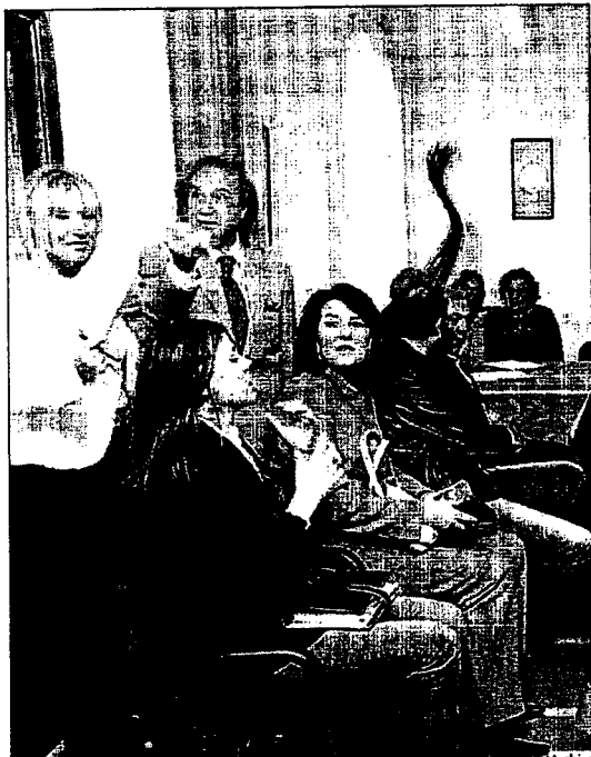
Rilo, con miembros de la Comisión municipal contra la violencia.

Aunque el trago más duro llegó cuando recibió en el domicilio donde se esconde una citación para su marido, "porque era la dirección que tenía el Juzgado, a