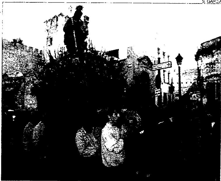
►► El santo bajó ayer en procesión hasta San Agustín.

el sábado, dentro del programa de festejos del barrio, dedicados a San José. La imagen del santo salió ayer por la tarde en procesión desde su ermita hasta la iglesia de Santa María la Real y regresará mañana a las 20.15 horas en un recorrido que se adentra en el barrio.