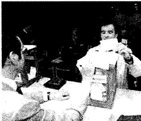
Un abogado colegiado deposita su voto en la urna.