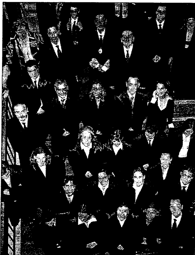
► Los últimos abogados en jurar.

► Los justiciables son los que conocen mejor que nadie cuáles son los problemas que plantea la Administración de Justicia, que aspectos se deberían mejorar y en cuáles habría que incidir. Debería existir un sitio donde pudieran resolver sus dudas y donde recibirían asesoramiento sobre los servicios de justicia gratuita, opinan los jóvenes abogados de Gijón. Aseguran que son los propios letrados los que están asumiendo, en este sentido, tareas de las que debería hacerse responsable la Administración.