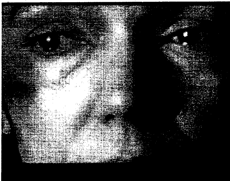
DENUNCIAS. Imagen de una campaña publicitaria contra los malos tratos.

Para Inocencia Cabezas es un acierto que este tipo de delitos se tramiten como juicios rápidos,