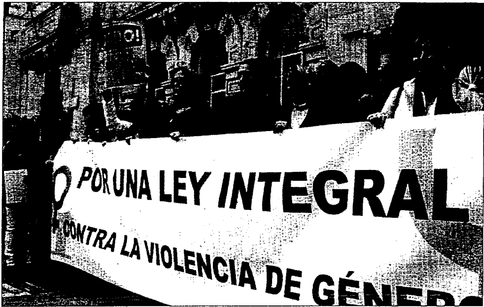
Un grupo de mujeres se manifestó frente al Ayuntamiento tras la muerte de Elisa Calderón en Santander.