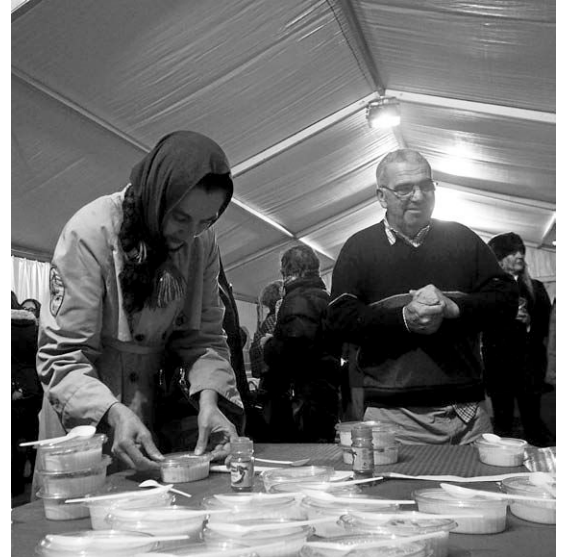
La degustación de arroz se realizó en la carpa del Cantón

Sin embargo, también hubo quien no quiso dejar de cumplir con la tradición y visitó el Cantón para tomar el arroz con canela a