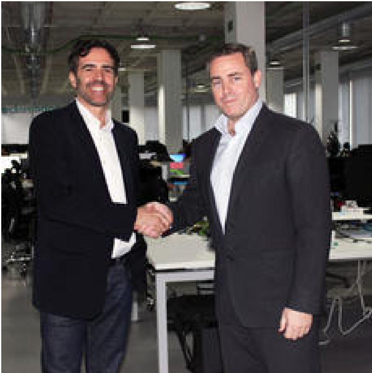
reclamador.es refuerza su financiación de la mano de Arcano Capital ( https://www.lawandtrends.com/noticias/despachos/reclamador-es-refuerza-su-financiacion-de-la-mano-de-arcano-capital-1.html )